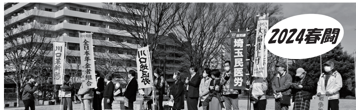
▲ 2.18川口地域総行動にて