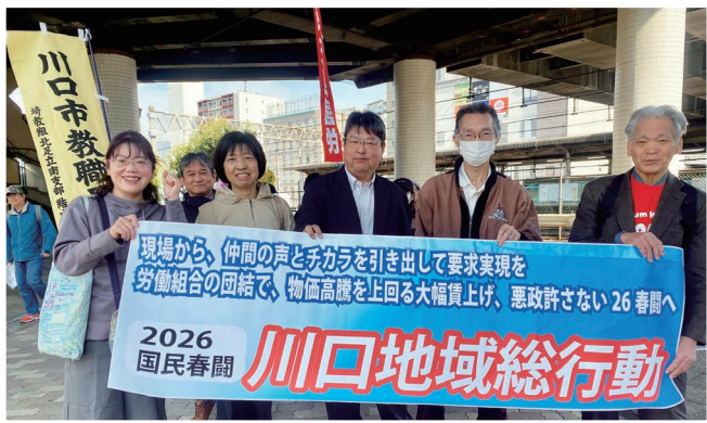
2026国民春闘 川口地域総行動にて 3.13 重税反対 川口大集会に参加