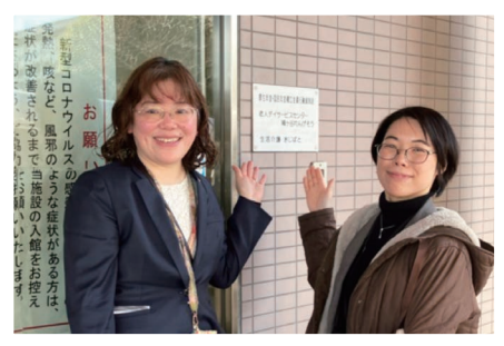
生活介護きじばと